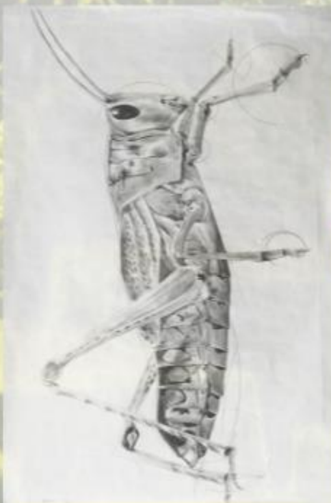
Dibujo, Alicia Pinto