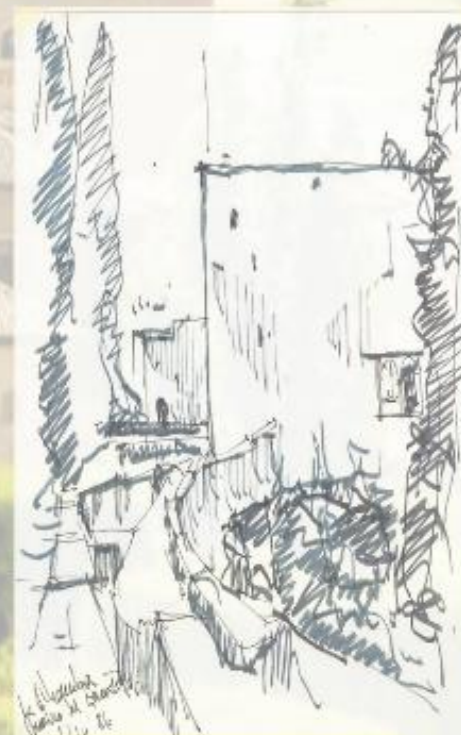
Apunte Jardines Alhambra: .Pioz