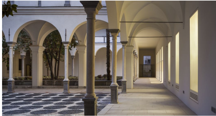
El patio renacentista