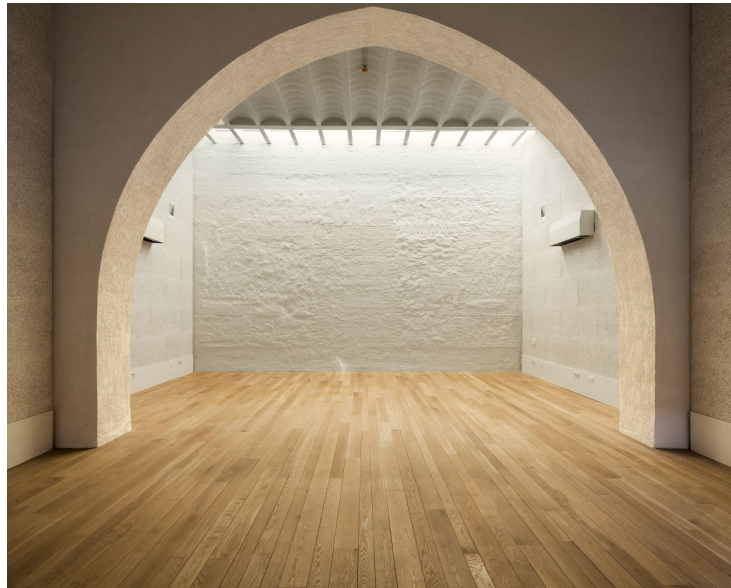
salon de grados