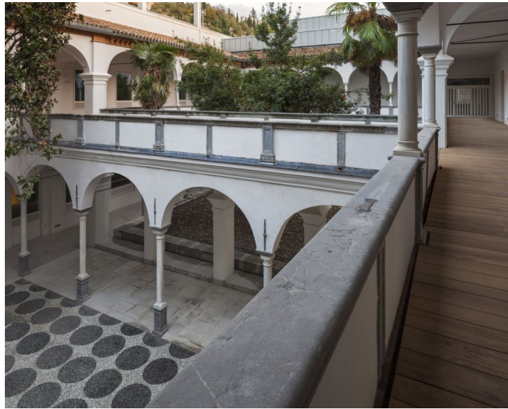
Galería planta primera