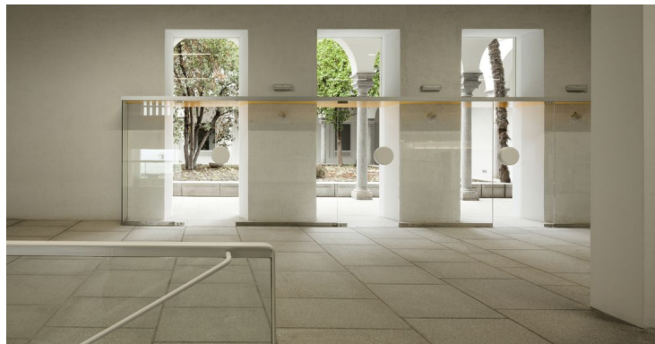
Sala planta baja