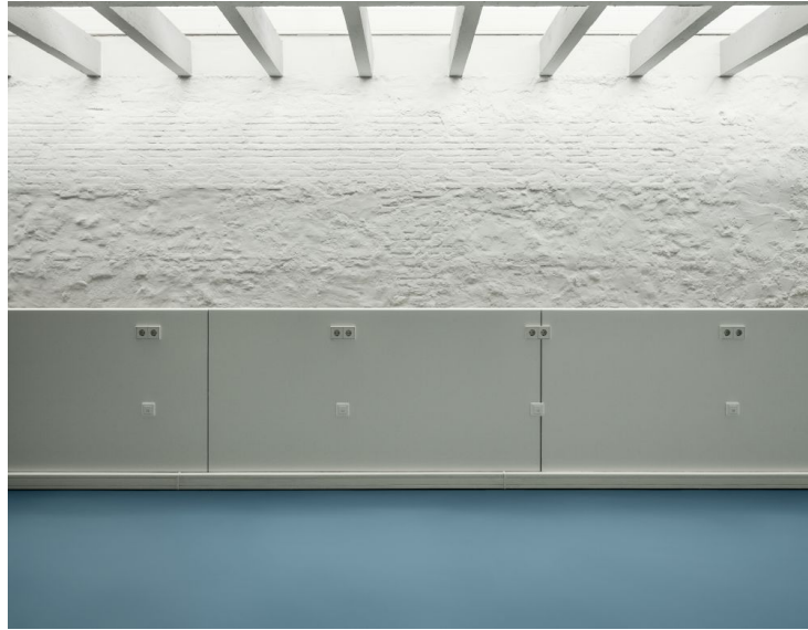
aulas de informática