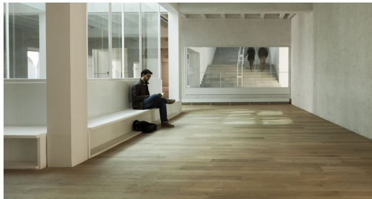
sala de exposiciones