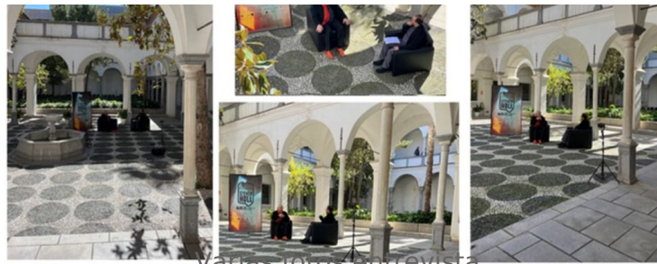
Varias fotos entrevista