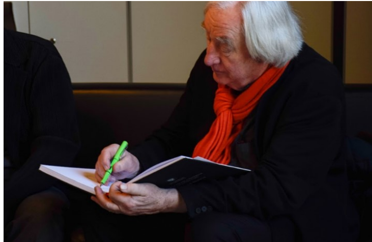
Firmando libro de honor de la ETSAG