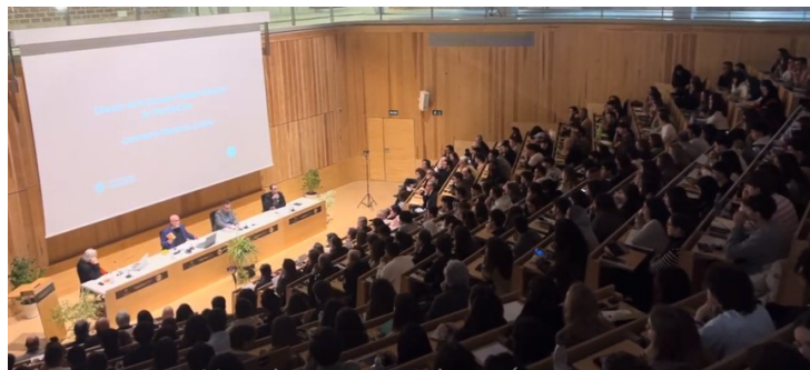
Una imagen vale más que...

El evento fue retransmitido en directo con la producción de http://www.directosconmovil.es/ por el canal de Youtube de la ETSA y contó con el servicio de traducción simultánea español-inglés ofrecido por https://www.electronicagalan.com/