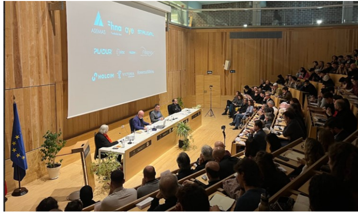
Mesa lección magistral 23-24