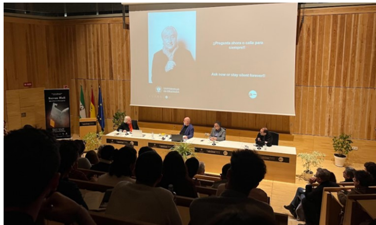
Mesa lección magistral Steven Holl