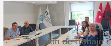
Reunión de trabajo con Departamento de Arquitectura de la UNYT