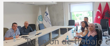
Reunión de trabajo con Departamento de Arquitectura de la UNYT