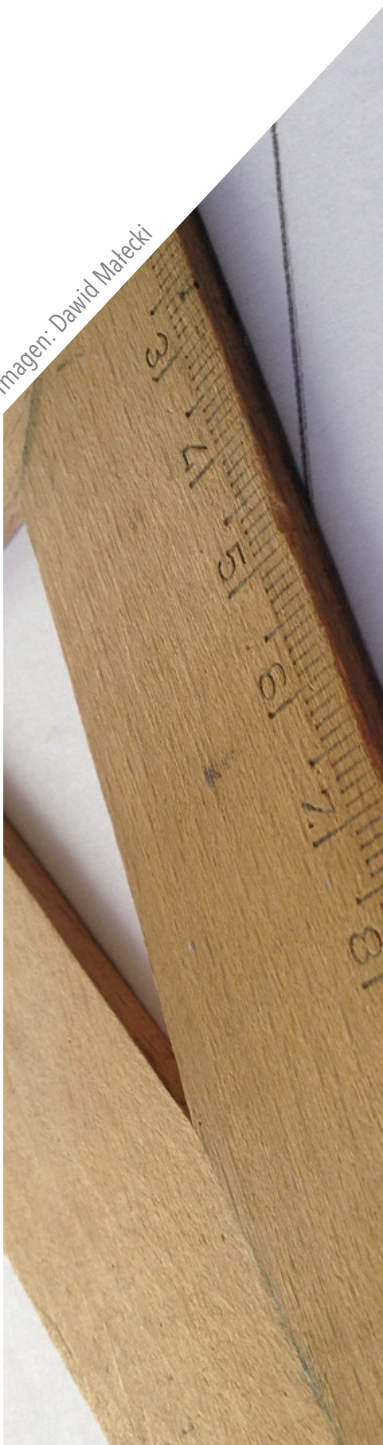
Imagen: Dawid Malecki