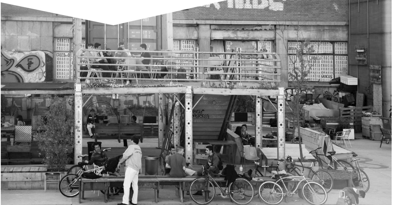
Imagen: Intervención en el Campo de la Cebada (Madrid)

El Comité organizador se compromete a reflejar dichos patrocinios en todos los materiales promocionales, webs y publicaciones relacionados con las jornadas.