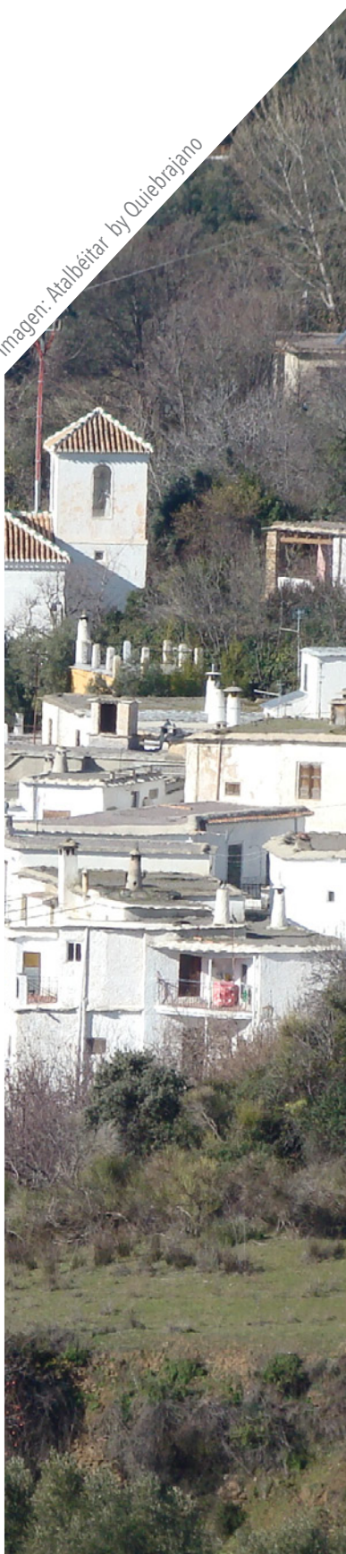
Imagen: Atalbéitar by Quiébrajano